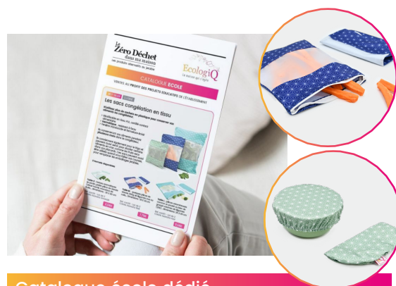
Catalogue école dédié

Du sac congélation en tissu aux cotons démaquillants lavables en passant par la lessive en feuille, chaque produit proposé contribuera à réduire ses déchets et réaliser des économies.